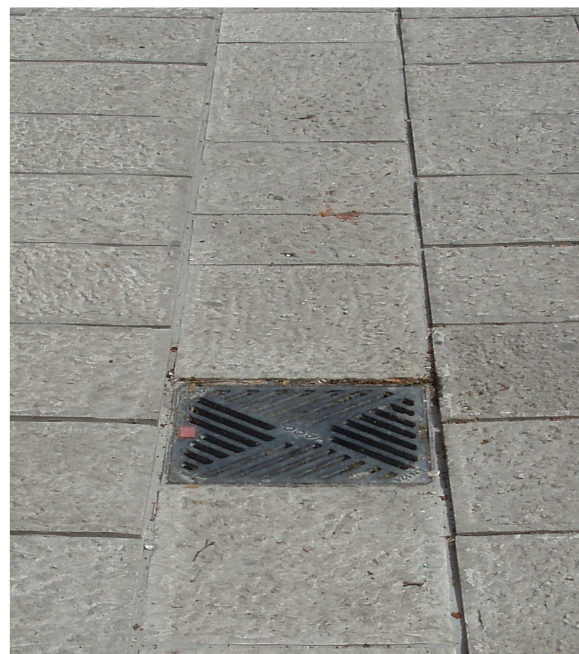
Bravadžiluk: ACO Drain Ulični slivnik