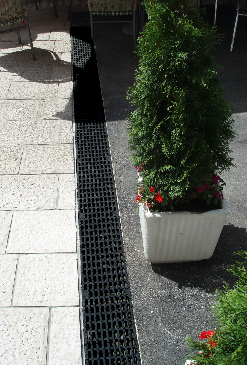
Bravadžiluk: ACO MultiDrain kanal V200S sa livenoželjeznom rešetkom