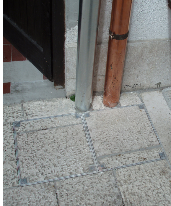
Bravadžiluk: ACO TopTek pocinčani poklopci